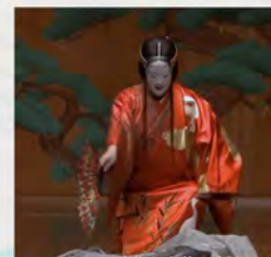
能の面や装束について